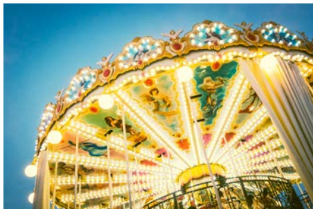
La Fête Foraine de Noël 27 novembre et 4 décembre 2021 À Paris