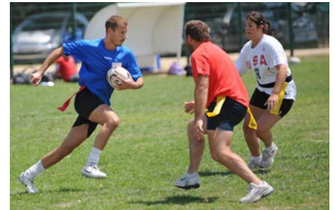
Initiation au Flag-rugby 2022