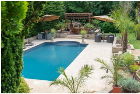
Aqua Kermesse Samedi 9, 16 et 23 juillet 2022 À Plaisir