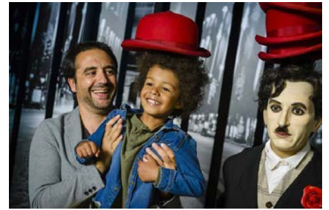
Visite du Musée Grévin Vendredi 18 novembre 2022 À Paris