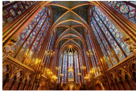
Visite de la Sainte-Chapelle et de la Conciergerie Vendredi 14 octobre 2022 À Paris