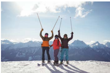
Week-end au ski Mars 2022