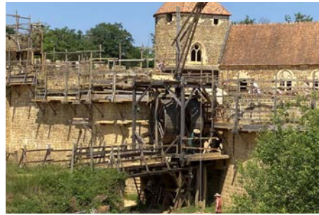
Week-end au château de Guédelon Fin septembre et début octobre 2022 À Treigny-Perreuse-Sainte-Colombe