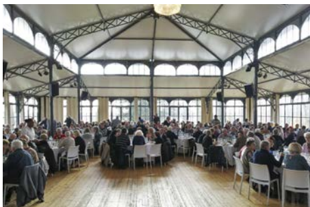
Repas de Noël des pensionnés Mardi 7 décembre 2021 À Coignières