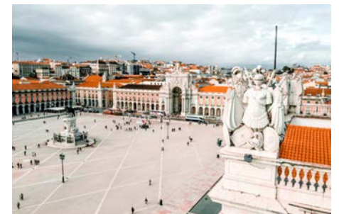
Séjour au Portugal Avril ou mai 2022