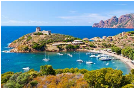
Séjour à La Réunion 10 au 20 octobre 2022