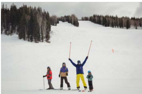
Semaine au ski 29 janvier au 5 février 2022