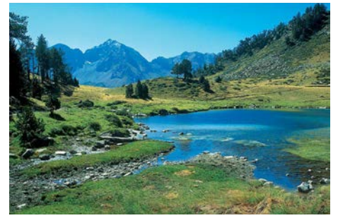
Randonnée dans les Hautes-Pyrénées 3 au 8 mai 2022 À Saint-Lary-Soulan