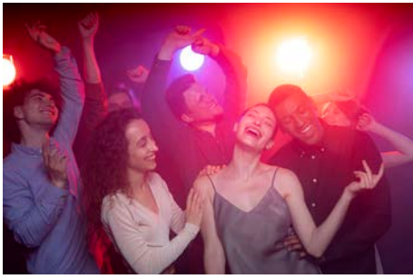
Soirée péniche Mi-juin 2022 Paris