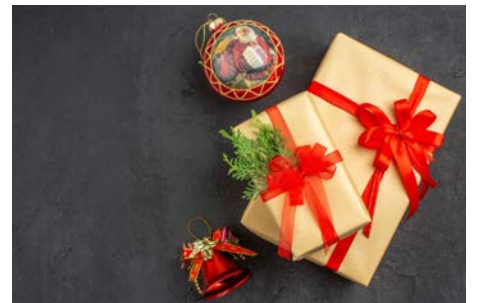
Distribution des jouets de Noël Décembre 2021 En SLV