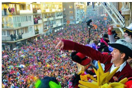
Carnaval de Dunkerque Janvier, février ou mars 2022 À Dunkerque