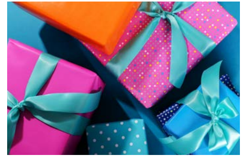
Distribution des jouets de Noël Décembre 2022 En SLV