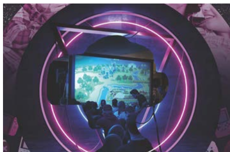
Salon E-Sport des Activités Sociales 7 novembre 2021 À Saint-Denis

Entrée gratuite / Restauration sur place