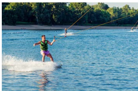
Wake Park Mai 2022 À Boissise-le-Roi (77)