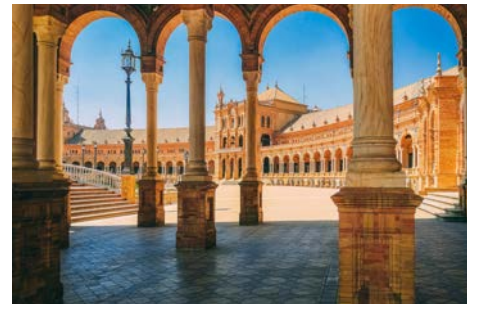
Week-end à Séville 4 au 6 juin 2022 En Espagne