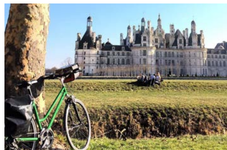
Week-end vélo et châteaux 14 au 18 avril 2022 En région Centre