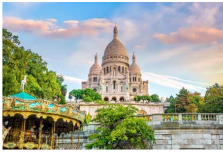
Sortie à Montmartre Vendredi 15 avril 2022 À Paris