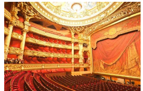
Sortie à l'opéra Garnier Vendredi 11 février 2022 À Paris