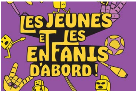
Les jeunes et les enfants d'abord ! 16 et 17 octobre 2021 À La Ville-du-Bois