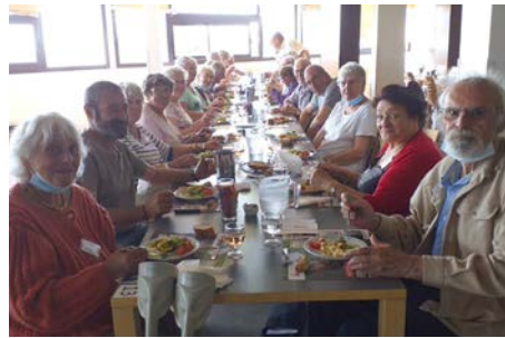
Séjour Réseau Solidaire 2022