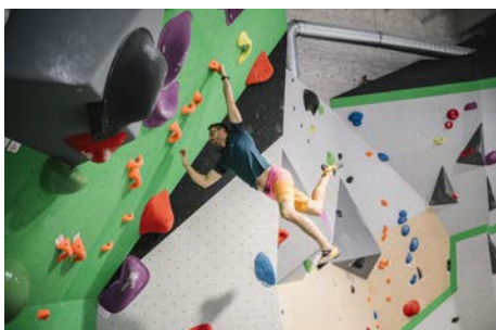
Vertical'Art 2022 À Montigny-le-Bretonneux