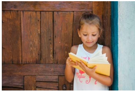
Distribution des livres de l'été Juin 2022 En SLV