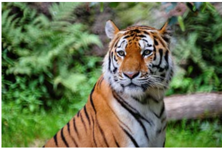
Le Parc des Félines 2022 À Lumigny-Nesles-Ormeaux