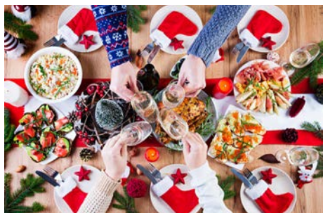
Repas de Noël 16 décembre 2021