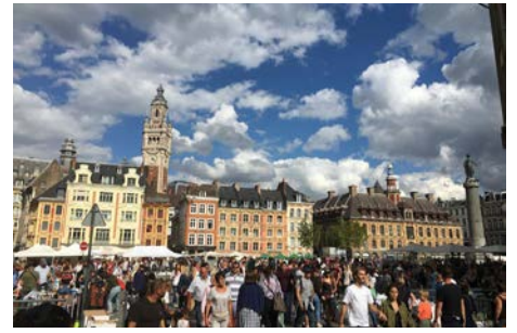
Week-end à la braderie de Lille 3 et 4 septembre 2022 À Lille