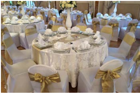
Repas de Noël des pensionnés Mardi 6 décembre 2022