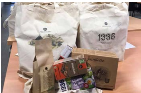
Distribution des paniers gourmands Actuellement En SLV