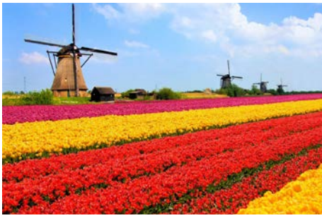
2 séjours en Hollande 5 au 7 avril 2022 8 au 11 avril 2022 En Hollande