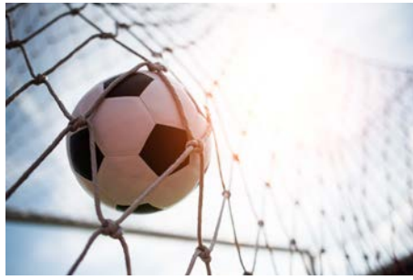
Tournoi de foot 2022