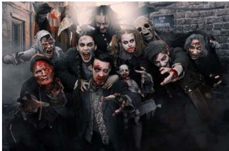
Halloween au Manoir de Paris 31 octobre 2022 À Paris