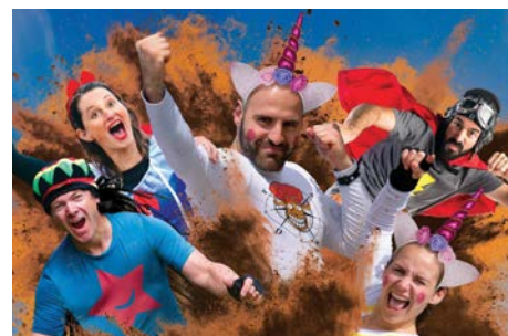
La Ruée des Fadas Fin mai et début juin 2022 Yvelines