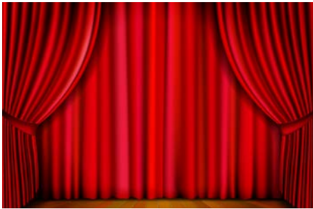
Le spectacle de Noël Entre novembre et décembre 2022