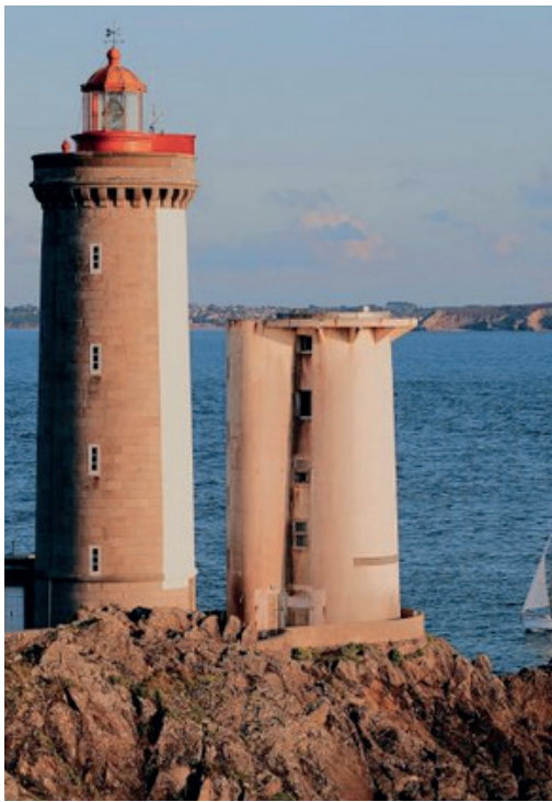
Les voies vertes du canal du Midi